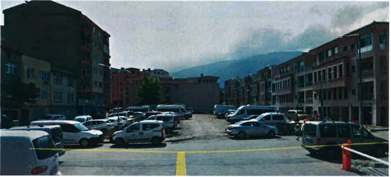
Resim 3. Sokak Görünümü