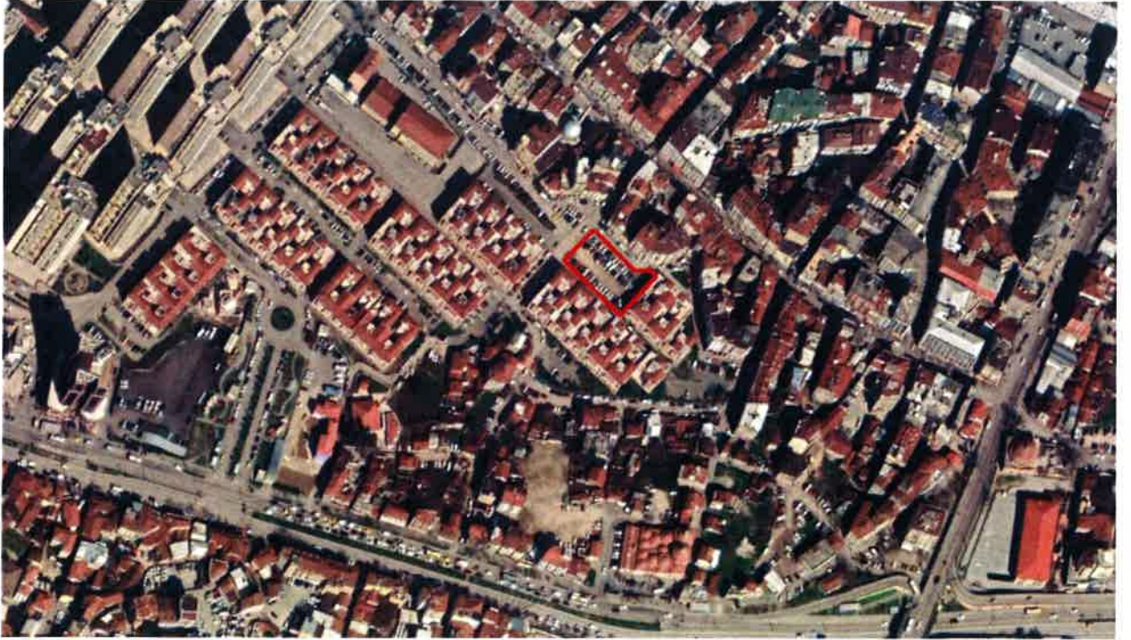
Resim 2. Mahalledeki Konumu