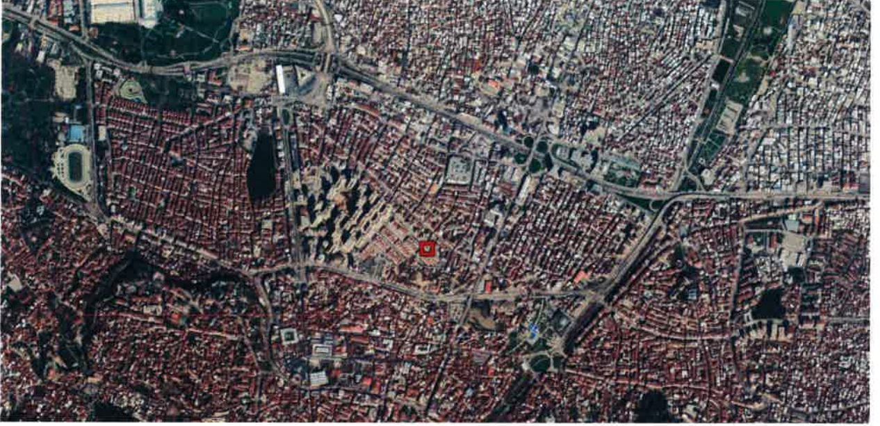
Resim 1. Bölgedeki Konumu

Plan değişikliğine konu, 1309 m 2 büyüklüğündeki Osmangazi İlçesi, Tayakadın Mahallesi, 7303 ada 8 parsel, Ankara Yolunun 600 m. güneyinde, Haşim İşcan Caddesinin 200 m. kuzeyinde ve İnönü Caddesinin 250 m. doğusunda yer almaktadır.